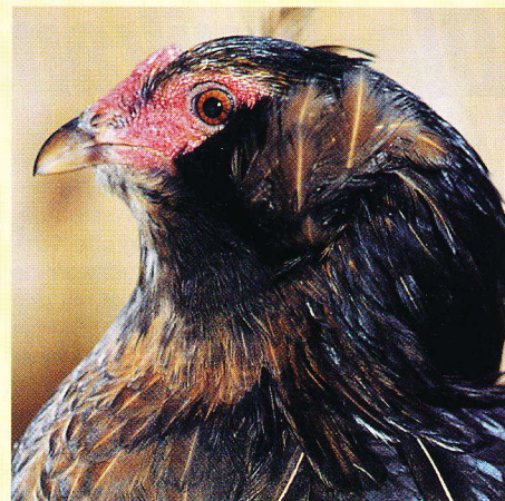
Die Bommel ist ein einzigartiges Rassemerkmal. Es soll nach den Vorstellungen des BMELF eliminiert werden.