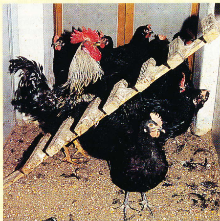
Chilenische Landhühner, die grüne Eier legen. Man bezeichnet sie als Araucanas; sie haben jedoch nichts mit der deutschen Standardrasse gemein

Ihre Lebensweise wandelte sich mit der Zeit vom Jäger und Sammler zum sesshaften Pflanzler, wobei Jagd und Fischerei begleitend betrieben wurden. Ihre Siedlungen lagen oft im Wald oder am Waldrand. Die nördlich siedelnden Mapuche wurden von den Inkas unterworfen. Von ihnen lernten sie verbesserte Ackerbautechniken und den Umgang mit Haustieren. Die südlich lebenden Mapuche