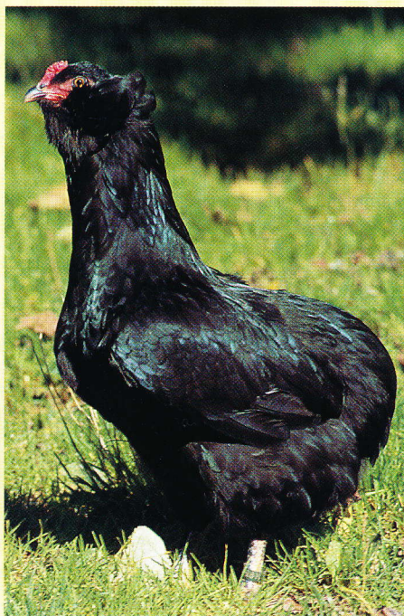
Araucana-Henne nach dem deutschen Standard. Ihre Zucht orientiert sich an der erwähnten Abbildung von 1927

ansässigen Füchse auf Federvieh ist auf einen Angriff von hinten ausgerichtet. Sie ergreifen Araucana-Hühner und später von den Spaniern importierte Hühner am Schwanz. Schwanzlose Hühner, die in jeder Rasse immer wieder mutativ auftreten, konnten leichter entkommen. So soll sich die Mutation „Schwanzlosigkeit“ der Araucana-Hühner gefestigt haben bzw. zum Selektionsvorteil geworden sein. Zugleich schränkte die Schwanzlosigkeit den Schreckflug nicht sonderlich ein, so dass das Fehlen des Steuerinstruments „Schwanz“ keinerlei Nachteile nach sich zog, und schon gar nicht die fehlende Bürzeldrüse, deren Vitamin-D-Produktion maßlos überschätzt und fehlinterpretiert wird von Kreisen, die sich zum Ziel gesetzt haben, schwanzlose Hühnerrassen aus Deutschland zu verbannen. Außerdem dürfte die Schwanzlosigkeit gerade in rauen und regenreichen Gebieten Vorteile gegen widrige Witterungseinflüsse bringen, da keine sich ent-